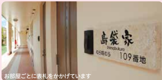
お部屋ごとに表札をかかっています