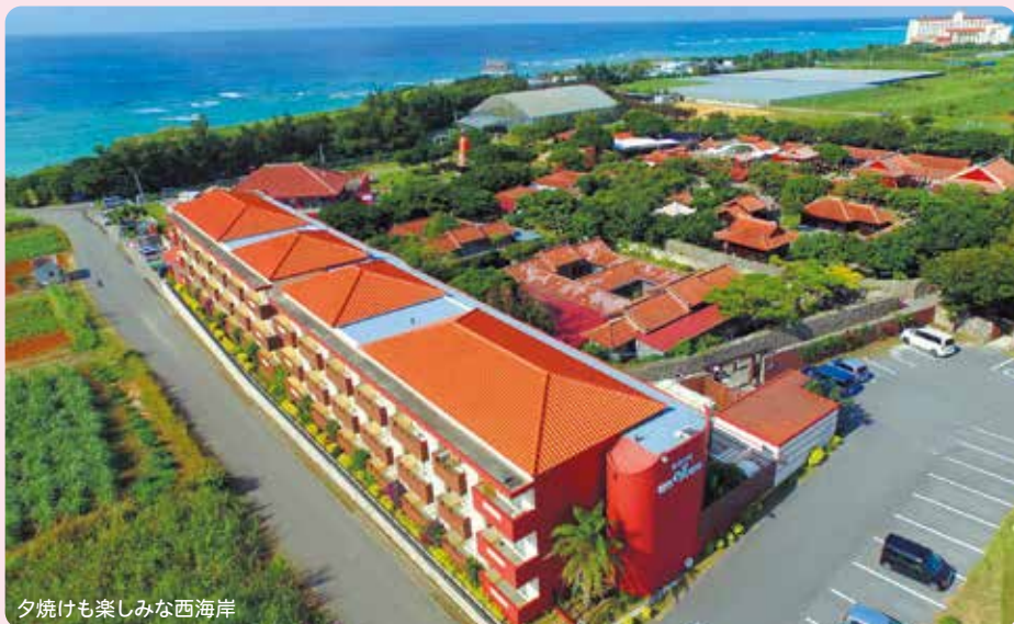
夕焼けも楽しみな西海岸