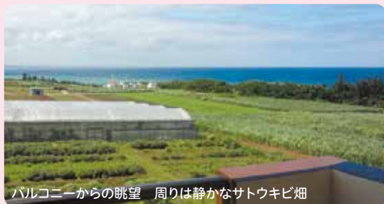
バルコニーからの眺望 周りは静かなサトウキビ畑